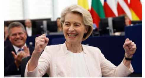
Ursula von der Leyen, az Európai Bizottság elnöke

Von der Leyen második bizottságában hat kiemelt ügyvezető alelnök lesz, de megszűnik az alelnöki poszt, ami ebben a formában rengeteg konfúzióhoz vezetett az előző öt évben. A megválasztott elnök azal magyarázta a szerkezeti változtatást, hogy az új szerkezetben mindenkinek együtt kell majd dolgoznia, és szándékai szerint megszűnik az a széttozottság, amely az előző bizottságokat jellemezte. A testület főbb céljai közé tartozik az Európai Unió versenyképességének javítása, a jólét megőrzése, a demokrácia megerősítése, a digitalizáció és az innováció, egy