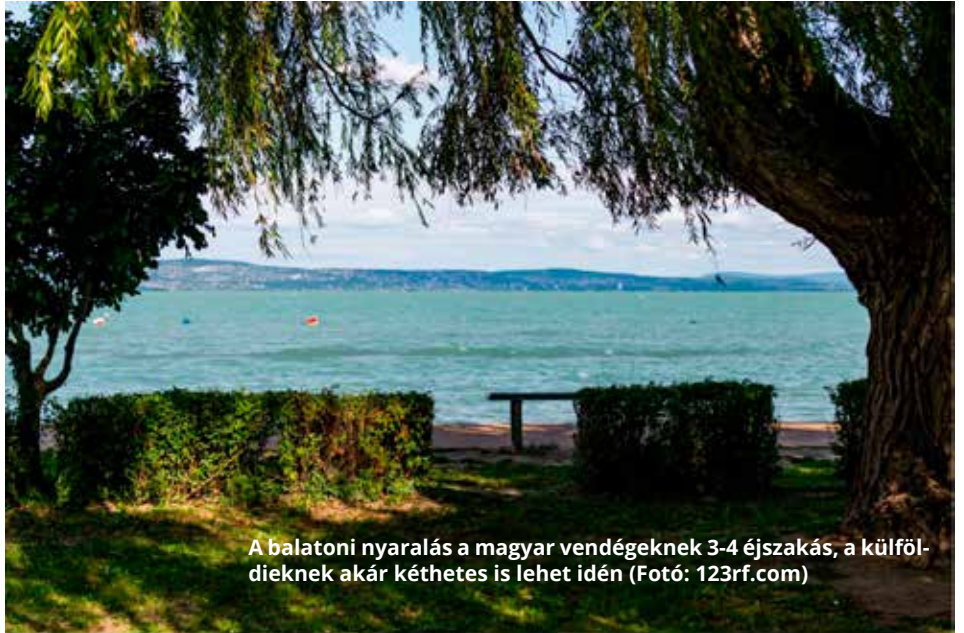
A balatoni nyaralás a magyar vendégeknek 3-4 éjszakás, a külföldieknek akár kéthetes is lehet idén

A balatoni, turisztikai vállalkozóknak is hozzá kell szokni, hogy a globális piaci helyzet az eddigieknél gyorsabban változik, ennek hatása pedig a korábbiaknál gyorsabban gyűrűzik be a tópart turizmusába is – fogal-