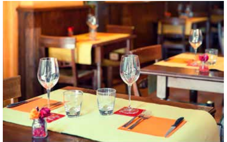
A lehetőség elsőként az egész évben nyitva tartó, vidéki éttermeknek nyílt meg május 27-től

A június 28-ig tartó első ütemben az egész évben nyitva tartó vidéki éttermek üzemeltetői adhatják be támogatási igényeiket.